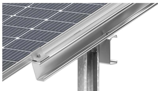
L - подібний сталевий профіль