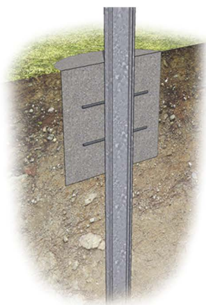
Забивний з бетонуванням